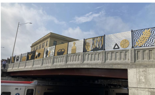
Damien Davis, Empirical Evidence , 2021, aluminum, 3 rd Avenue Bridge, Mount Vernon, MNR